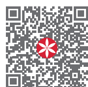
MINT Newsletter abonnieren